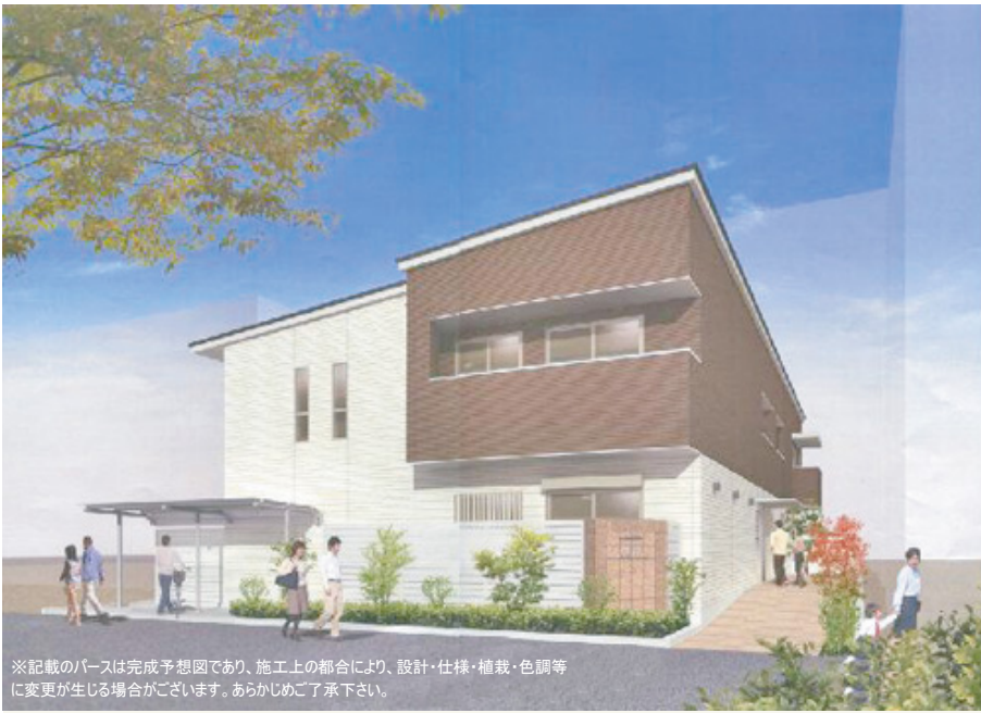
※記載のバースは完成予想図であり、施工上の都合により、設計・仕様・植栽・色調等に変更が生じる場合がございます。あらかじめご了承ください。