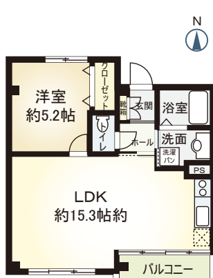
B type 1LDK ■ 専有面積 44.00㎡