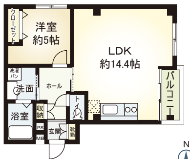
C type 1LDK ■ 専有面積 44.00㎡