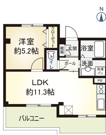
B' type 1LDK ■ 専有面積 37.00㎡