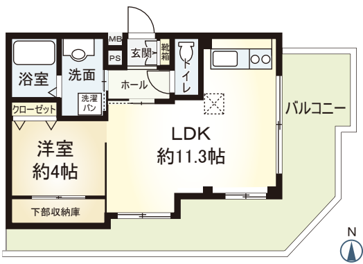
A' type 1LDK ■ 専有面積 38.00㎡