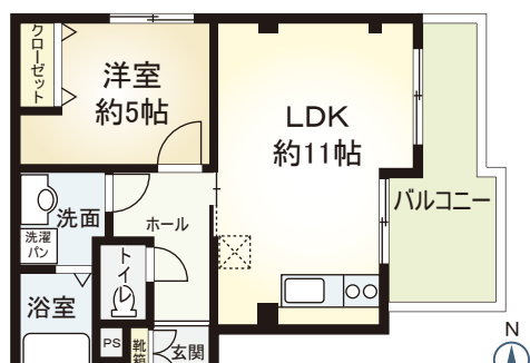
C' type 1LDK ■ 専有面積 38.00㎡