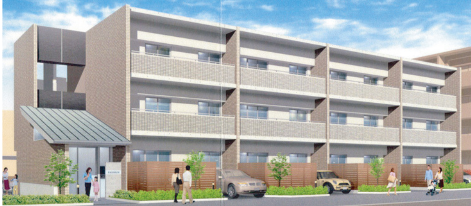
※記載の図面は完成予想図であり、施工上の都合により、設計・仕様・植栽・色調等に変更が生じる場合がございます。あらかじめご了承ください。