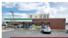
ファミリーマート 伊丹野間2丁目店 徒歩 1分 (約 32m)