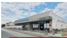
万代 伊丹野間店 徒歩 4分 (約 268m)