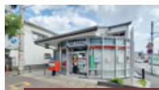
伊丹野間郵便局 徒歩 2分 (約 117m)